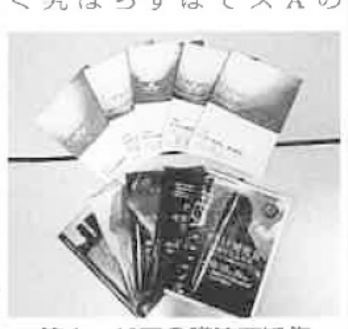
第1~10回の講演要旨集

「10年を振り返って...」と、ユニークなスタイルの... 研究者が、目的の... 企業に求められている... 成果は、このように... 現在、セラミドは... 2017年(平成29年)11月23・30日(合併号) (毎週木曜日発行)